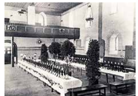
Müllheimer Weinmarkt 1926

(Abbildung: Müllheimer Weinmarkt 1926 in der Martinskirche).